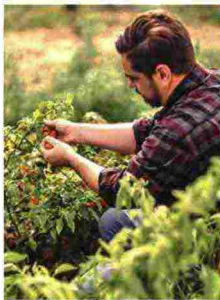
Sopra, San Gimignano, gioiello medievale famoso per le sue torri. Sotto, un agronomo al lavoro nella tenuta e il corso di sopravvivenza nei boschi all'interno dell'Adventure Park Castelfalfi.