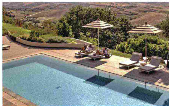
A sinistra, camera e piscina dell'hotel 5 stelle Toscana Resort Castelfalfi ( castelfalfi.com ). Completamente rinnovato nel corpo centrale, ha anche dei casali restaurati (alcuni con piscina) che si possono affittare in più famiglie o con comitive di amici.